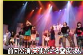
前回公演(天使がいる聖夜)より

公演日 2014年2月9日(日)・11日(火・祝) 12:00~16:00~ 4回公演