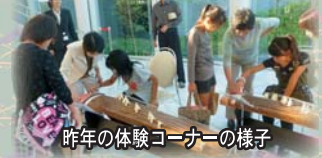
昨年の体験コーナーの様子