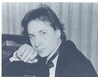
Oliver Triendl オリバー・トリンドル

1966年、クリヴィッツ/メックレンブルグに生まれ4歳からピアノを習い、72年、シュペリナー・コンセルベトリウムに入学。76年、国民ピアノコンクールに入賞後、77年に音楽のためのベルリン特別学校に入学、82年よりベルリンのハンス・アイスラー音楽大学でピアノ、伴奏法、打楽器を、87年より指揮法を学ぶ。89年にブランデンブルク劇場で客演指揮し、同年、同オーケストラの音楽最上指揮者に、93年より芸術監督に就任する。