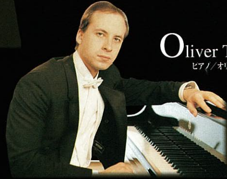
Oliver Triendl ピアノ / オリバー・トリンデル