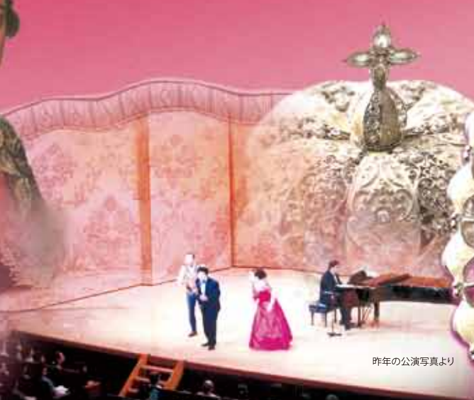
昨年の公演写真より