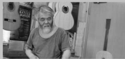
バンブーギター製作者

45年以上に渡る、クラシックギター製作の研究を続け、世界中からギター製作に必要な木材を集め、寝かし、自分の求めている音色(福よかな中音域、クリアな高音域、太く重い低音、心地よい余音)を追求し、ギター製作に日々励んでおります。